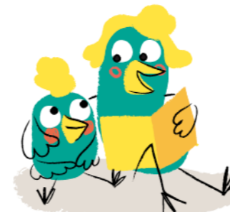
Illustration : © Mylène Rigaudie / Milan Presse 2020.

GEO ADO , tous les mois une fenêtre ouverte sur notre monde complexe et passionnant.