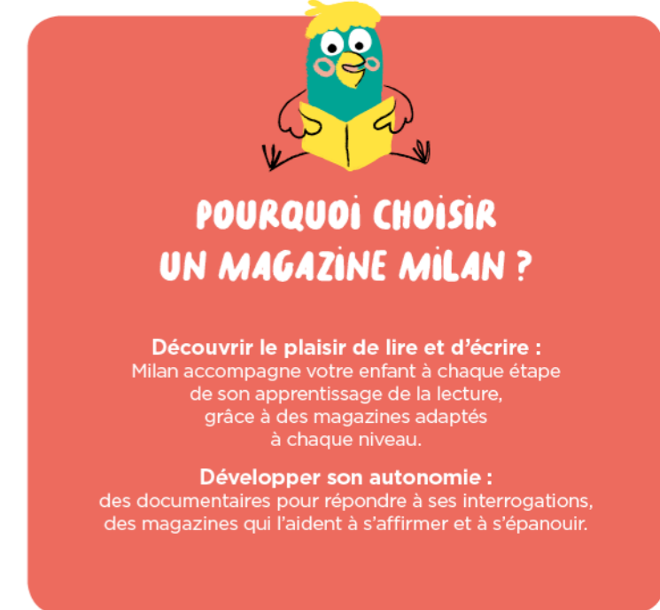
Illustration : Mylène Rigaudie